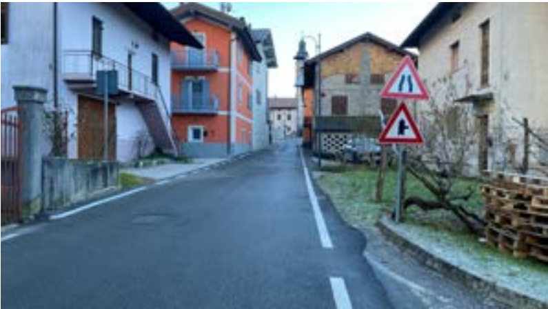
ASFALTO VIA ROMA