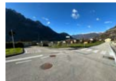
MODIFICA INCROCIO VIA NOELLE