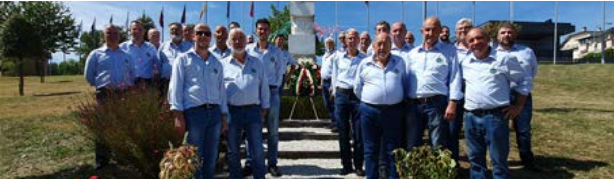
Il Coro Valbronzale

Direi che possiamo essere soddisfatti di quanto in cascina e di cosa ci prospetta il futuro. Vogliamo da ultimo rivolgere a voi tutti i migliori auguri di un sereno Natale.