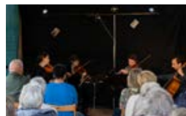
L'ARTE DE L'OMBRIA - VELON QUARTET