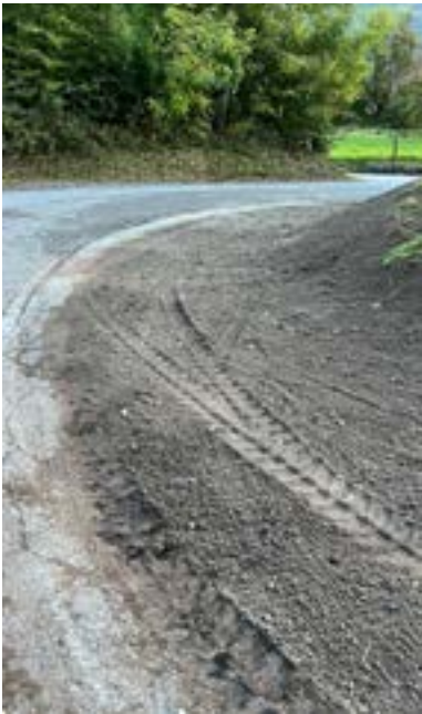
ALLARGAMENTO CURVA MADONNA DELLA ROCCHETTA

I lavori hanno riguardato l'ampliamento della curva di Via alla Rocchetta, migliorandone la visibilità e la sicurezza.