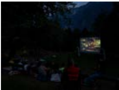
I MITCHEL CONTRO LE MACCHINE