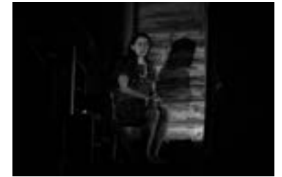
ALLA CORTE DELLE DONNE - CARA PENELOPE

ha voluto proporre ben sette date. Si è iniziato con il film di animazione "I Mitchel contro le macchine" al parco della Rocchetta, per continuare poi con il film di avventura "Jumanji - benvenuti nella giungla" , proiettato in teatro a causa del maltempo. Entrambe le proiezioni hanno visto una buona partecipazione di pubblico. Partecipazione che non è mancata ai concerti e agli spettacoli teatrali dedicati a bambini e famiglie. Ha aperto la serie dei tre concerti la cantautrice trentina Maria Devigili al Cantone Saltorati sotto il vecchio gelso. È seguito poi il primo dei due spettacoli dedicati ai bambini, "Arlecchinate" , uno