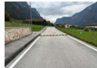
DOSSI VIA NOELLE