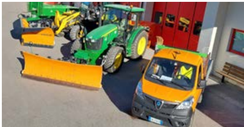
NUOVO PARCO MEZZI