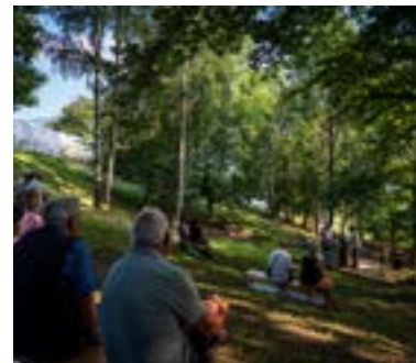
L'ARTE DE L'OMBRIA - MISTIC VIBES