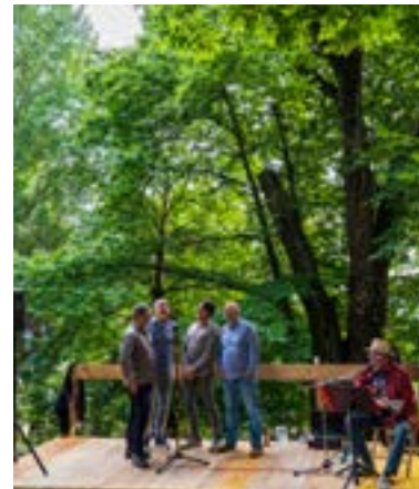
L'ARTE DE L'OMBRIA - GRUPPO VOCALE SINTAGMA

per dare il nome al nostro progetto. "L'ARTE DE L'OMBRIA" nasce così ed evidenzia un ulteriore punto di contatto fra i due mondi: infatti quando la campagna veniva lavorata soprattutto a braccia, quando non esistevano i condizionatori, l'ombria di un albero, di un muro, diventava luogo di ristoro per il corpo accaldato. Così come l'arte lo è per lo spirito. L'altro aspetto importante del progetto è fare del momento artistico anche un'occasione, da un lato per incontrare i produttori agricoli biologici sia locali che provenienti da altre zone del Trentino, dando loro l'opportunità di portare a conoscenza del pubblico presente le varie produzioni; e dall'altro di far conoscere le particolarità del territorio circostante attraverso delle iniziative collaterali, per l'organizzazione e la gestione delle quali è stata fondamentale la collaborazione con L'Ecomuseo Valsugana. Così come lo è stata con la Pro Loco di Spera per l'aspetto logistico. Il progetto è stato promosso, oltre che da noi e dall'azienda che ci ha ospitati, dall'Associazione Taiapaia attiva in ambito culturale sui temi dei diritti umani, pace, cittadinanza attiva, am-