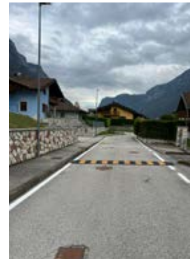
DOSSI VIA NOELLE

Rispondendo alla richiesta dei residenti, nei mesi scorsi si è intervenuti sulla viabilità di Via Noelle, attraverso la modifica dell'incrocio ed il posizionamento di due rallentatori.